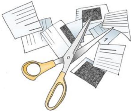
Abbildung 3: Wie wird plagiiert? (Weber-Wulff, 2004)

Das im Kurzbeleg genannte Werk muss im Literaturverzeichnis aufgeführt werden.