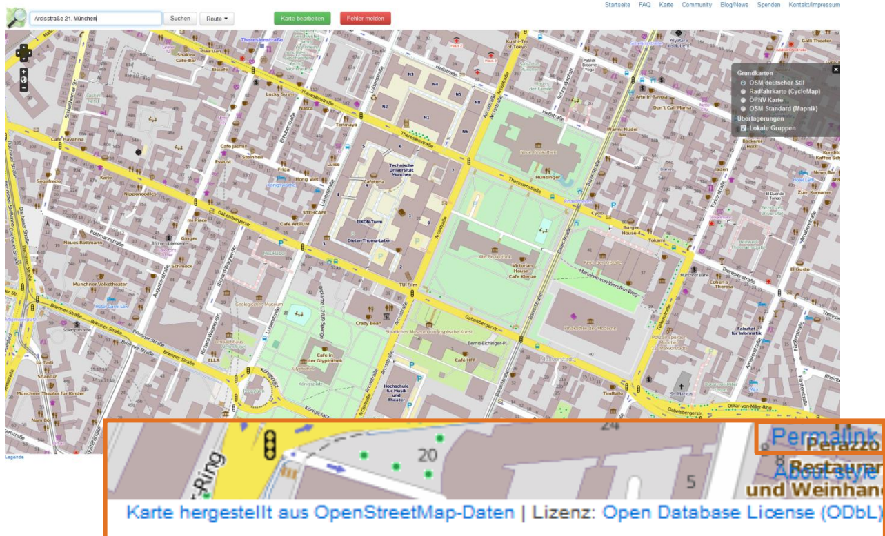
Karte 1: Arcisstraße 21, München (Open Street Maps, 2016) veröffentlicht unter Open Database License ODbL

Wenn Sie viele Karten in Ihrer Arbeit verwenden, legen Sie in Ihrer Arbeit ein Kartenverzeichnis an, in dem alle Karten aufgeführt sind.