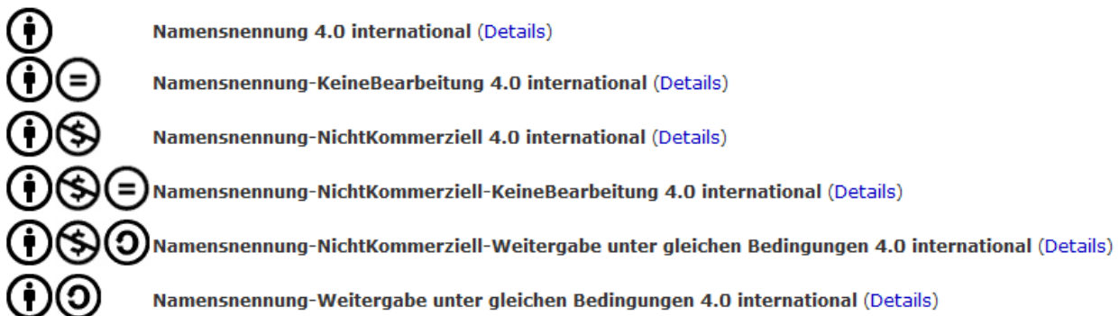
Abbildung 5: „Auswahl von insgesamt sechs verschiedenen CC-Lizenzen, die dem Rechteinhaber derzeit in der Version 4.0 zur Verfügung stehen“ (Was ist CC?, 2014)

Folgende sechs Lizenzen stehen derzeit zur Verfügung 18 .